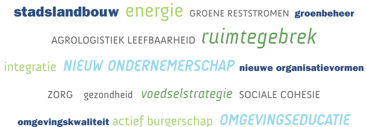
Figuur 2.2: stadslandbouw heeft betekenis voor een grote diversiteit aan thema's

Er zijn zeker 15 concrete activiteiten en projecten geïnitieerd en uitgevoerd. Bij veel projecten heeft OSA een verbindende en/of adviserende rol gespeeld. Enkele voorbeelden zijn: